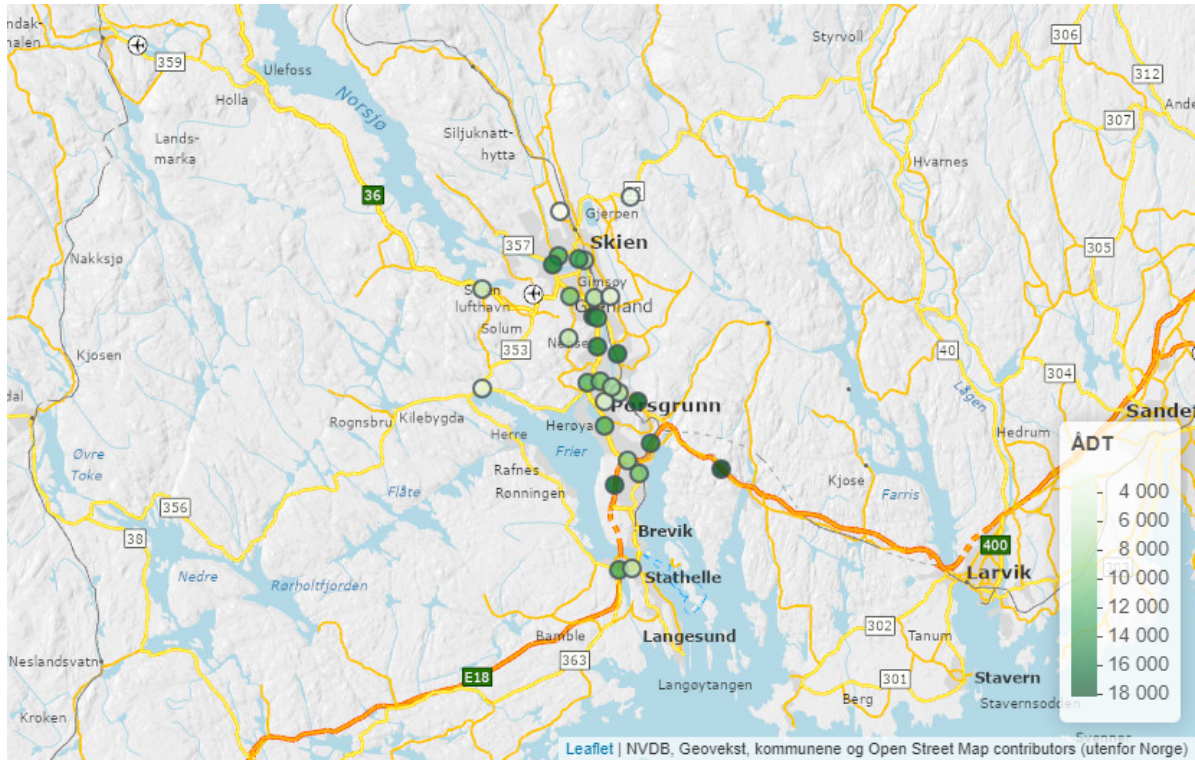
Figur 1. Kart som viser trafikkregistreringspunkt og årsdøgntrafikk.

Kartet i figur 1 viser plasseringen av trafikkregistreringspunktene i avtaleområdet.