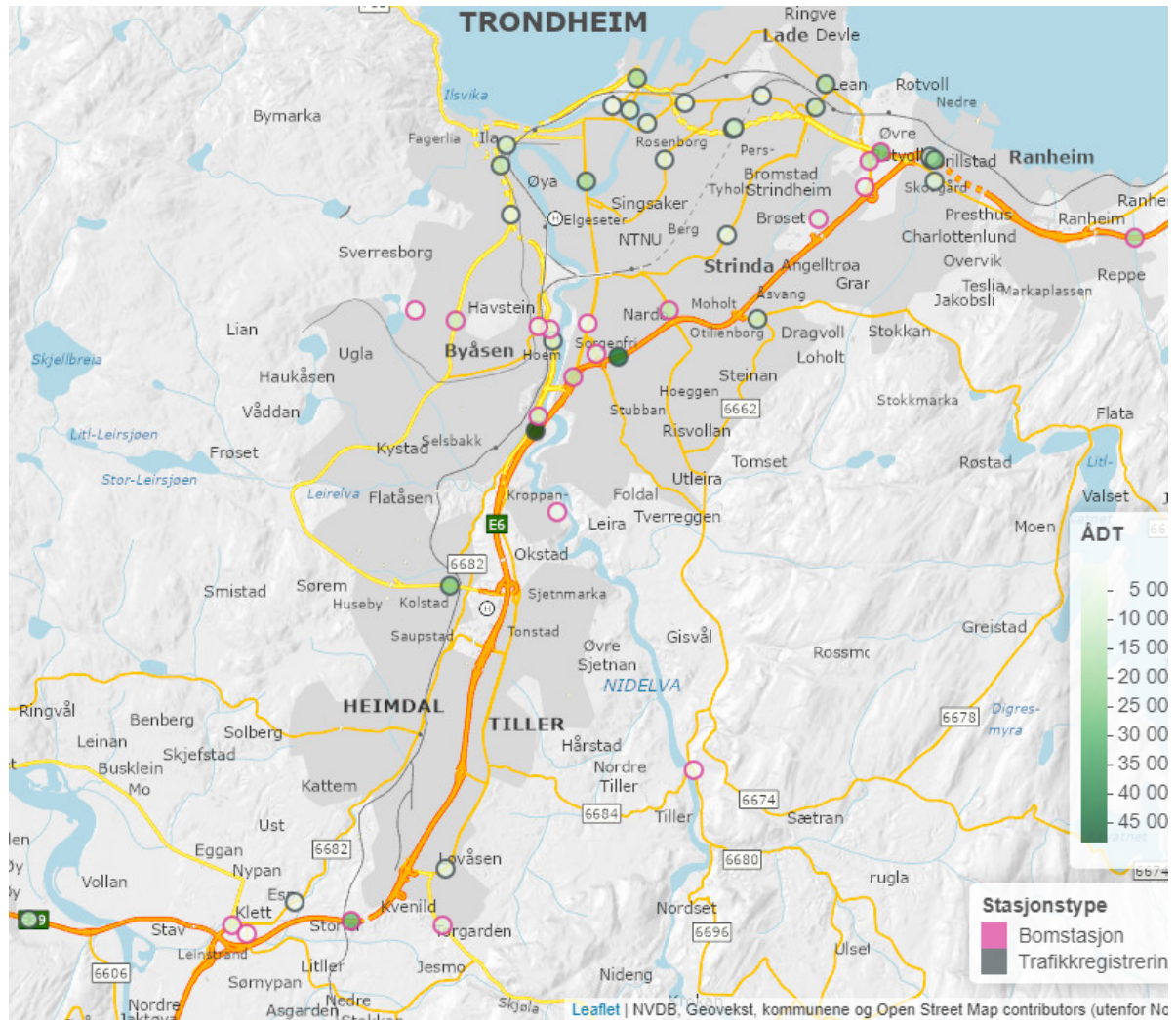
Figur 1. Kart som viser trafikkregistreringspunkt og årsgjennsnittstrafikk.

Kartet i figur 1 viser plasseringen av trafikkregistreringspunktene i avtaleområdet.