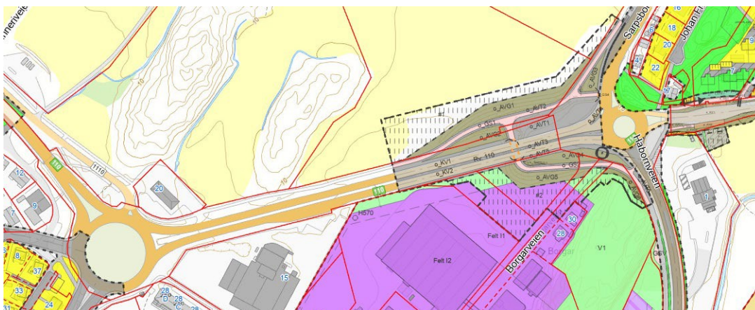
Figur 4: Reguleringsplaner