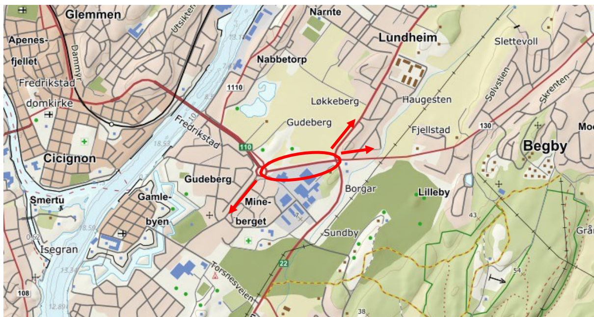
Figur 1: Planområdets beliggenhet og tilknytning