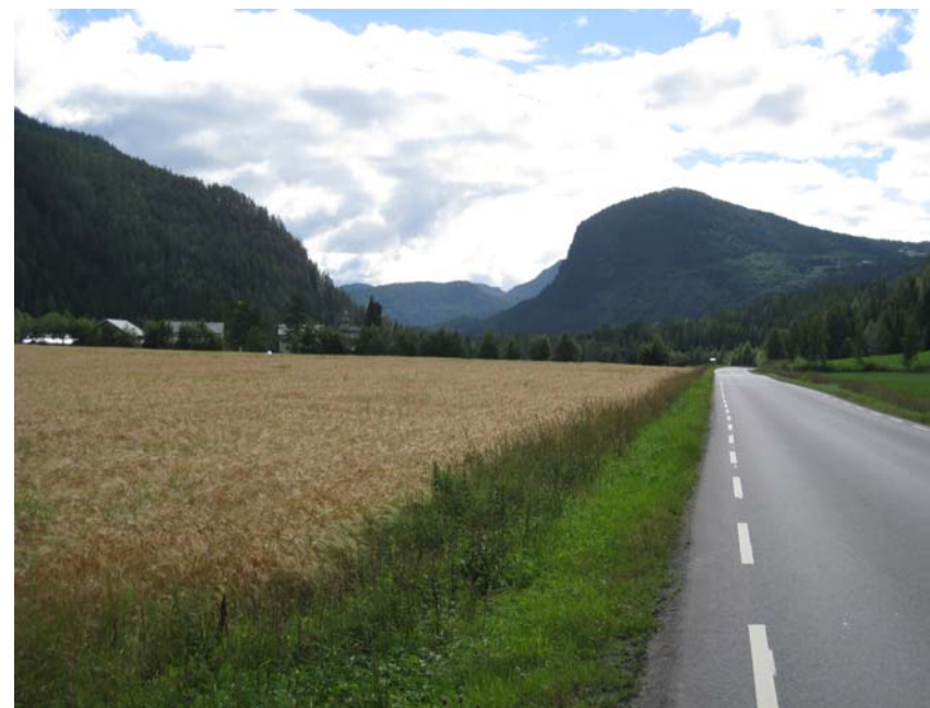
Foto: Landskapet langs E16 varierer fra bratt og utilgjengelig til flatt og åpent.

Planstrekningen Fønhus bru – Dølvesæter følger Begnavassdraget i et kupert landskap med bølgende åser. Bratte lisider mot Begna med markante fjellrygger kjennetegner planområdet. Stedvis åpnes landskapet opp i et frodig jordbrukslandskap. Belter av furuskog brytes opp av lisider med gran og frodigere lauvvegetasjon. Spredte gårdstun og boligbebyggelse langs hele strekningen