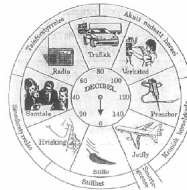
Støynivå for ulike støykilder

En grov oversikt over hva slags støynivå forskjellige støykilder er vist på figuren nedenfor.