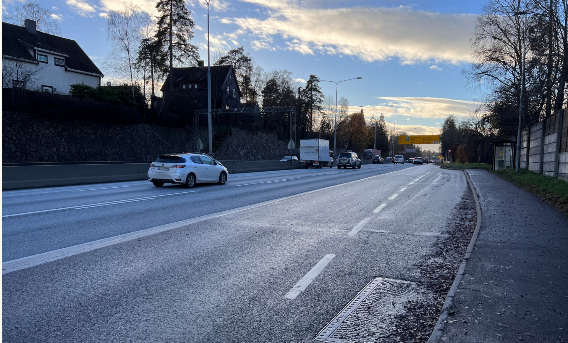
Holdeplass Strand vestgående