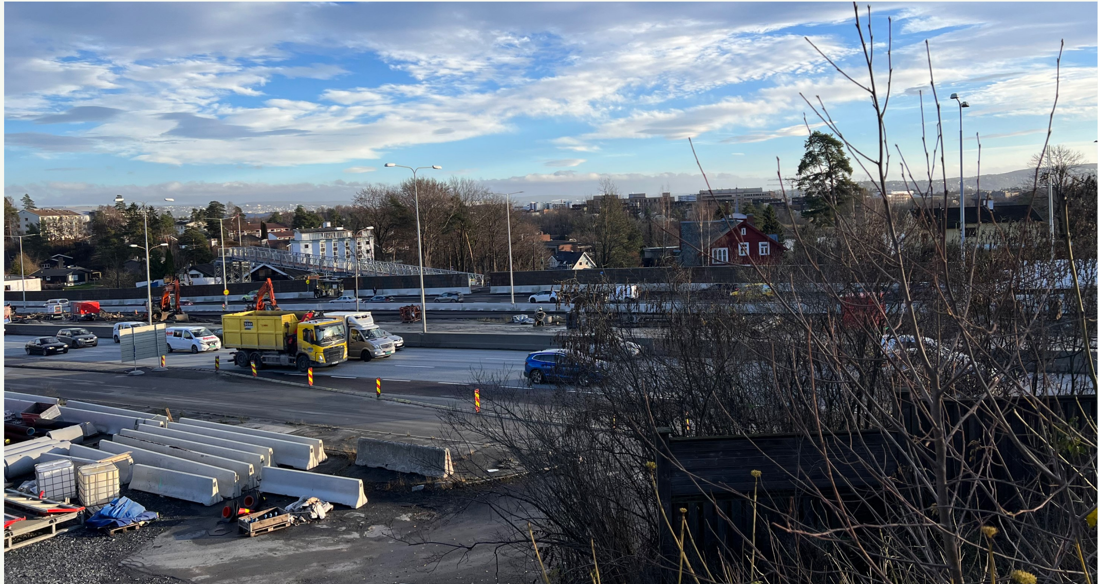
Holdeplass Strand østgående retning er flyttet. Midlertidig gangbru over E18 under etablering.