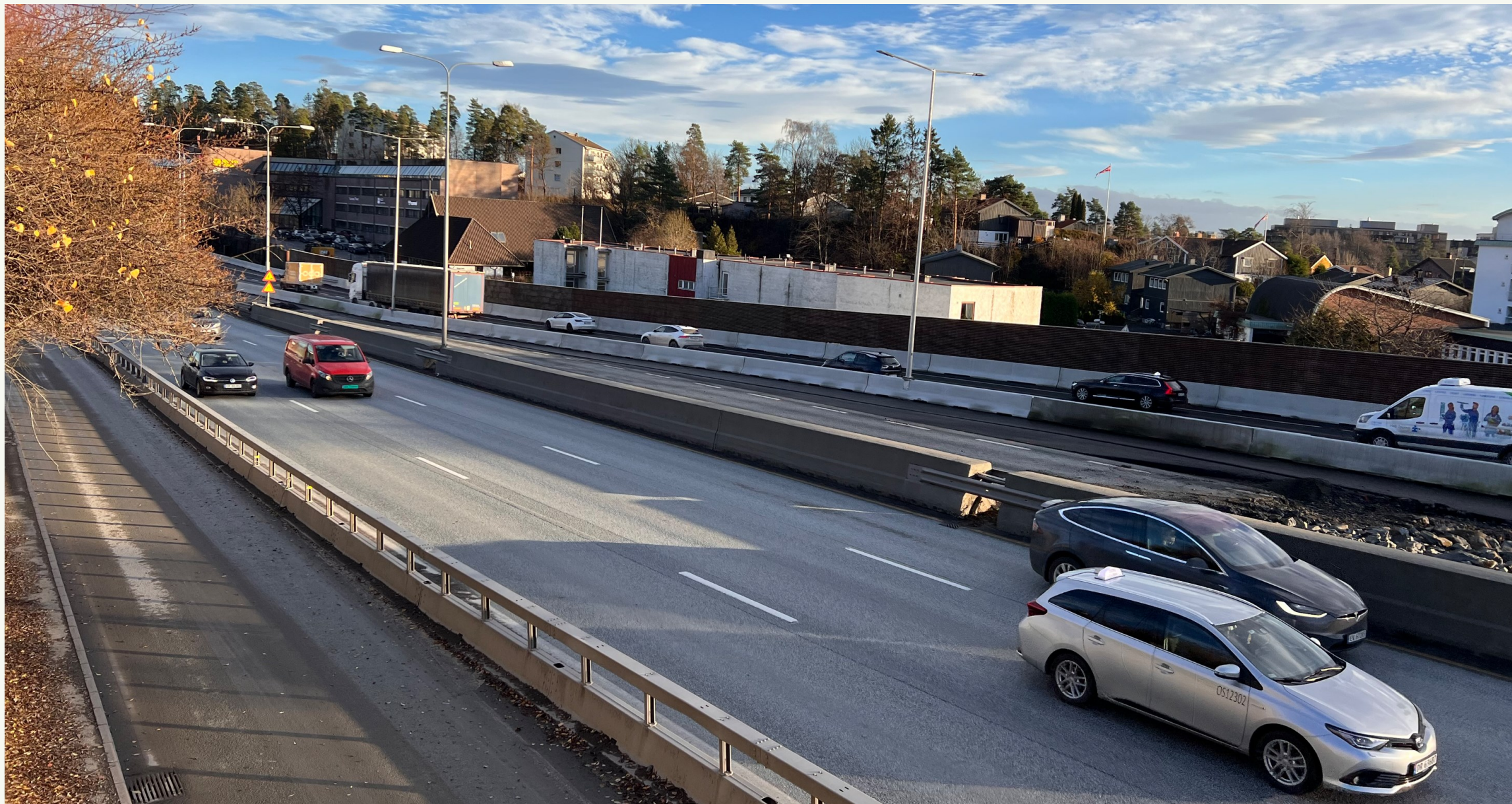
E18 sett mot øst. Støyskjerm avgrensner omlagt E18 mot Holtekilen folkehøyskole som ligger lavere enn vegkorridoren.