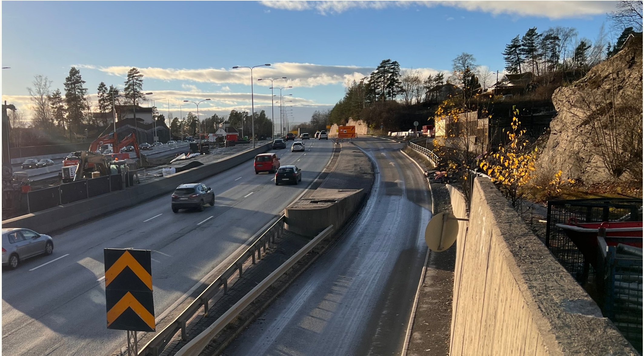
E18 sett mot vest. Granittmur og høyere vegetasjon er bevart på nordsiden av vegen. Bebyggelse langs Kveldsro terrasse kan sees på toppen av høydedraget. Sør for E18 er vegkorridoren utvidet for en midlertidig omlegging av E18- korridoren . Ny fjellskjæring langs vegen ligger tett opp mot gjenstående villabebyggelse sør for E18.