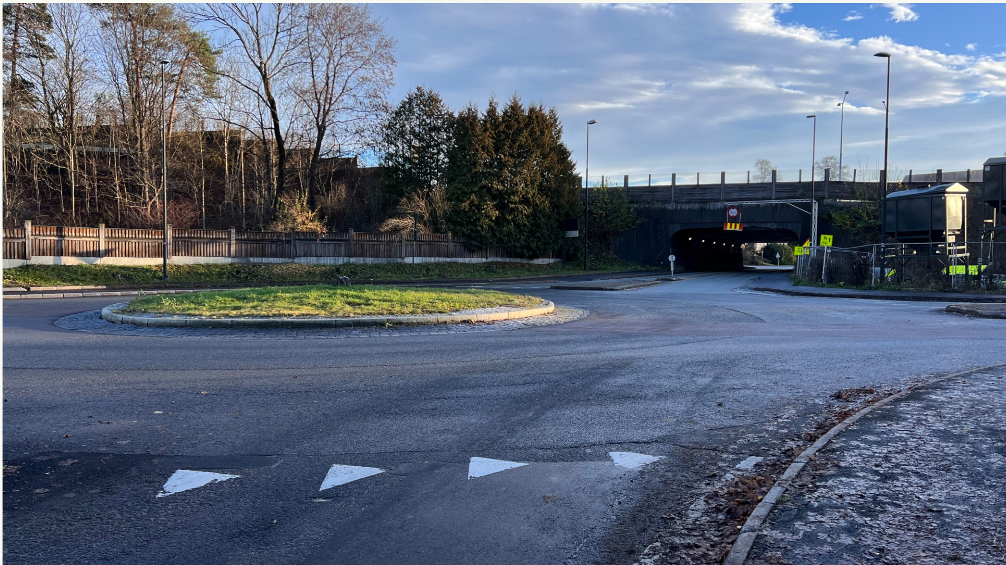
Strandkrysset - nord for E18, sett mot sør. Krysset ligger lavere enn E18 og terrenget langs veien. Høydedraget mot E18 avrundes av høyere vegetasjon sørøst for krysset.